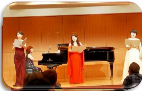
2022. 9. 20 (火) あなたの知らない日本の歌