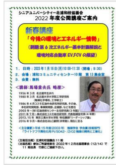
2023. 1. 16 (月) 新春講座