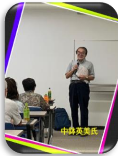
2022. 6. 28 (火) 歴史講座

2022年度は、「新型コロナウイルス」の下火傾向もあり、北協の行事もコロナ以前に回復した一年でした。マスク着用は従来通りでしたが、席の制限も緩和され、演奏会や、講演会等を楽しむ会員の姿が見られました。7月の「浦和おどり」は依然として中止でしたが、北協演芸会の昼休み時に全員参加の「浦和おどり」で盛り上がりました。