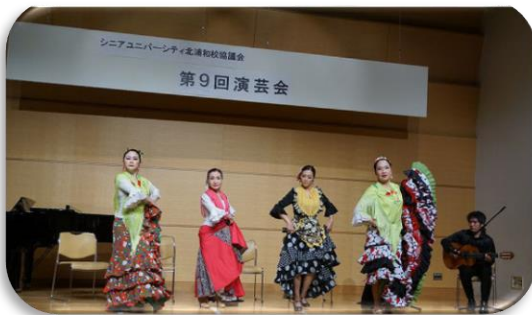
2022. 11. 21 (月) 北協・第9回演芸会