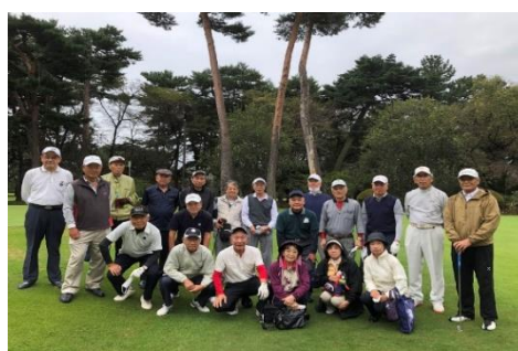
2022. 10. 5 ゴルフコンペ