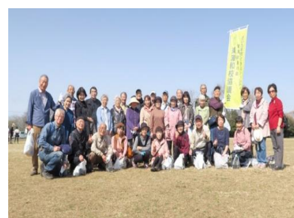
2023. 3. 11 見沼田んぼ キレイきれい大作戦