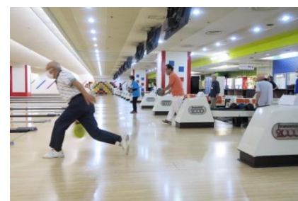
2022. 9. 22 ボウリング大会