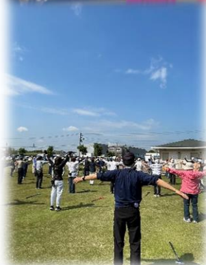
グラウンドゴルフ大会