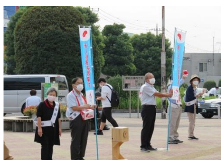
2022. 10. 3 赤い羽根共同募金