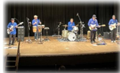
大宮ベンチャーズ ライブ