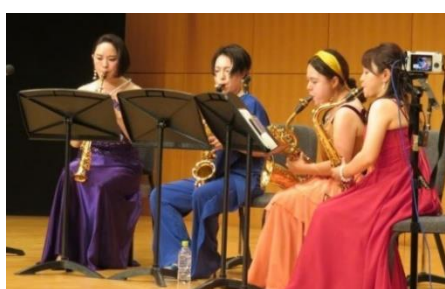
2022. 9. 8 サキソフォン演奏会