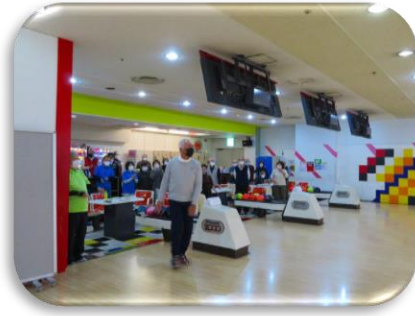
2022. 12. 12 (月) 第14回ボウリング大会