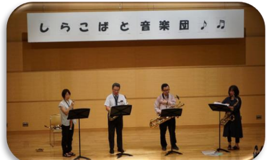
2022. 7. 19 (火) しらこぼと音楽団