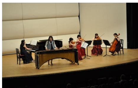
2022. 6. 15 マリンバピアノ演奏会

東浦和校協議会は、20年を超え今年で21期が参加してきた伝統ある協議会です。また、697名と最大の会員数を誇り、各期の交流と伝統を守るために様々なイベントを企画実施しております。運動系のイベントや文化系の演奏会等のイベント、また地元に貢献するボランティア活動など年間を通してバラエティにとんでおります。