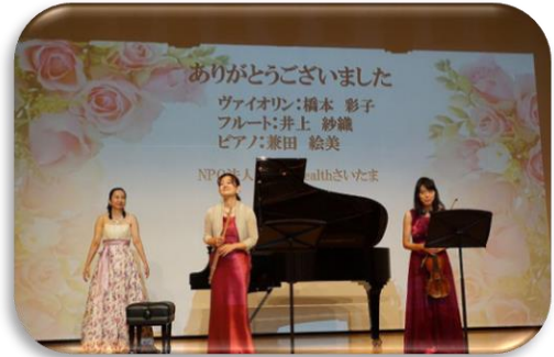
2022. 10. 18 (火) ヴァイオリン・フルト・ピアノ演奏会