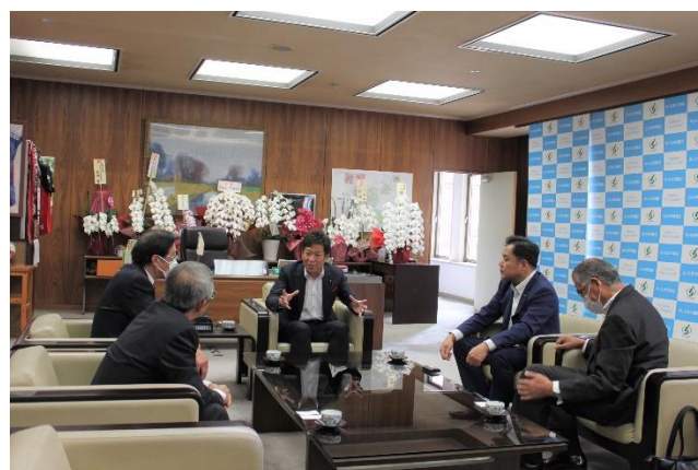
《正面、江原議長、 右から二人目、神坂副議長》