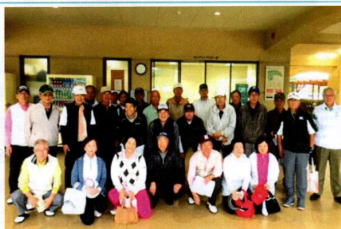
2018年9月協議会ゴルフコンペ

11期のゴルフクラブは年に1回の協議会ゴルフに参加するだけになりました。2016年の参加は6名でしたが昨年9月の参加者は4名でした。今年は何名参加できるかわかりませんが、年々体の具合等で参加者の減少が予想されます。今後は意欲のある方だけが協議会に参加することにし、少し体力的に楽なグラウンドゴルフの方に活路を見出したいと考えています。