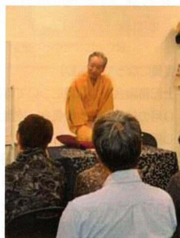
30年10月24日 第2回研修会