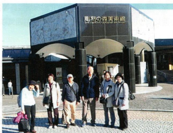
30年11月17日 箱根一泊ツアー